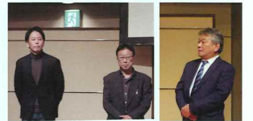
第11期入会加盟店の株主代表者（株）石川電気（中央）、（株）グリーングローブ（左）、（株）エクアプラン（右）