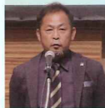
高本開発企画本部長