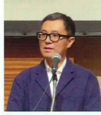
（株）LIXIL 大沼エクステリア事業部長