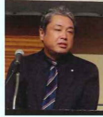
YKK AP 深川部長